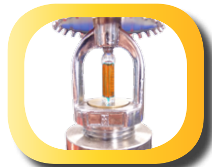
Ampoule thermique de détection (68°C) Heat sensitive bulb