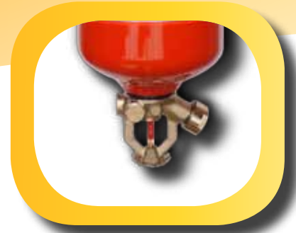
Tête en aluminium Aluminum head

Automatic Powder with heat sensitive bulb