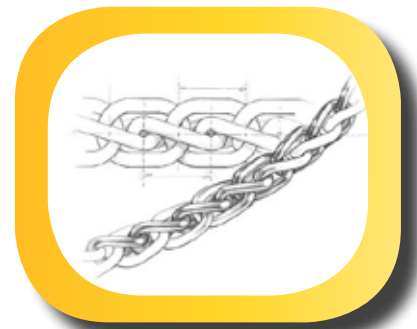
Suspendue à l'aide d'une chaîne Hanged by a chain