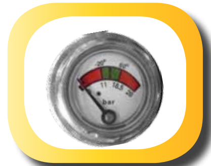
Manomètre de contrôle Pressure gauge